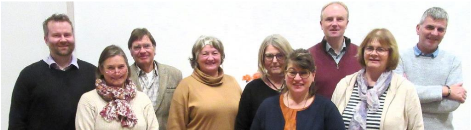
der bisherige Kirchengemeinderat

So., 11.01.2026: Einführung des neuen und Verabschiedung des alten Kirchengemeinderates.