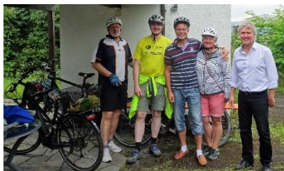
Gottesdienst zur Radchallenge vor der Petruskirche am 25.7.21