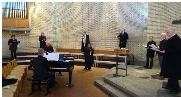
Gottesdienst mit wenigen Sängerinnen und Sängern des VEG