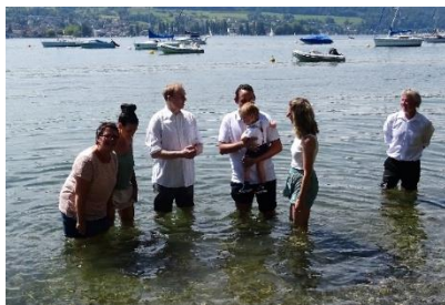
Seetaufe am 3.7.21